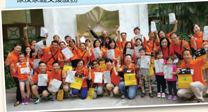
長期合作夥伴港島香格里拉大酒店的義工隊在出發前合影。