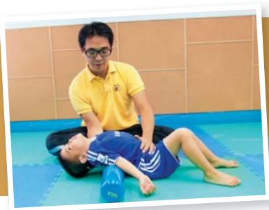
◀「健康伸活」等7個項目獲攜手扶弱基金批出配對基金