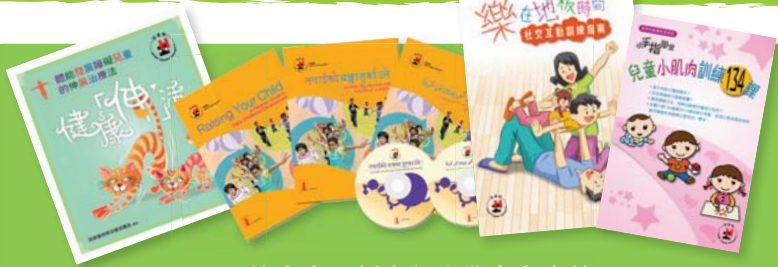
▲ 協康會最新出版專業育兒書籍