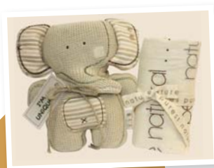
▲natures purest義買有機環保袋，為協康會籌款

本會另一個長期夥伴「有機天然彩棉」嬰兒用品專門店natures purest亦舉行了「傳頌愛慈善義賣」，出售有機針織小象玩具連同印有協康會學童親手寫上聖誕祝福的有機環保袋，所有收益不扣除任何開支，悉數撥捐協康會。