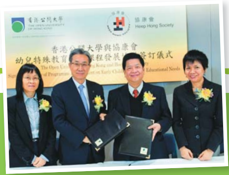
▲ 本會與公開大學簽訂特殊教育課程發展合作協議