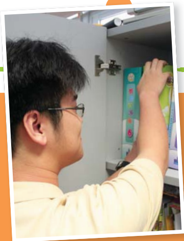
▲ 國樺在小學實習，初嘗文書處理，更了解自己的職業取向