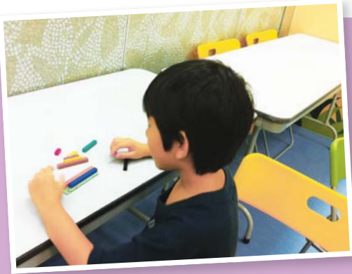
▲ 利用長短不一的實物，掌握抽象的數值概念