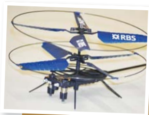
▲您的“Like”，為協康會弱兒送上一部遙控直昇機

需要孩子的關注，促進社會融合，由即日起，協康會Facebook專頁(www.facebook.com/heephong)每新增一個“Like”，本會轄下中心家庭便可獲贈一套遙控直昇機，讓有特殊需要孩子能在父母陪伴下享受「昇」空樂趣、增進親子感情。“Like”越多，受惠的孩子便越多。遙控直昇機由香港蘇格蘭皇家銀行送出，上限為600套，將由本會各服務單位以抽籤形式分配。誠邀各位透過一個“Like”，向有特殊需要孩子表達您的關懷，並邀請親友共襄善舉。