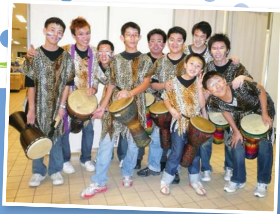
▲ 多次與非洲鼓班學員一起參與公開演出