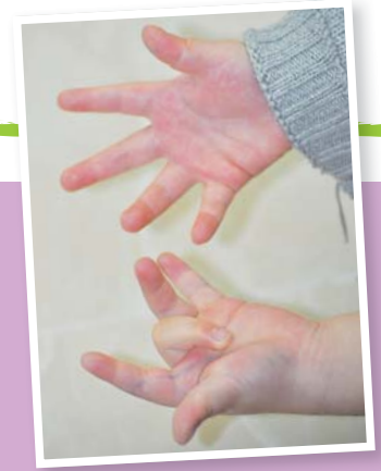
▲ 運用手指，輕易學習9的乘數