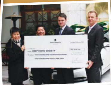
▼「平治聖誕禮物慈善抽獎」籌得善款捐予協康會