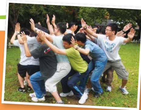
▲ 「自閉症青少年職前訓練計劃」提升學員的就業能力，建立其團隊精神